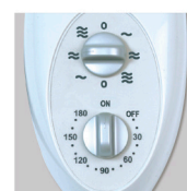
Artic 405 PM GR Переключатель скоростей и таймер.