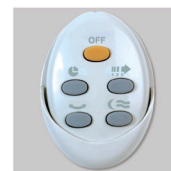
Artic-405 PRC GR Дистанционный пульт управления.