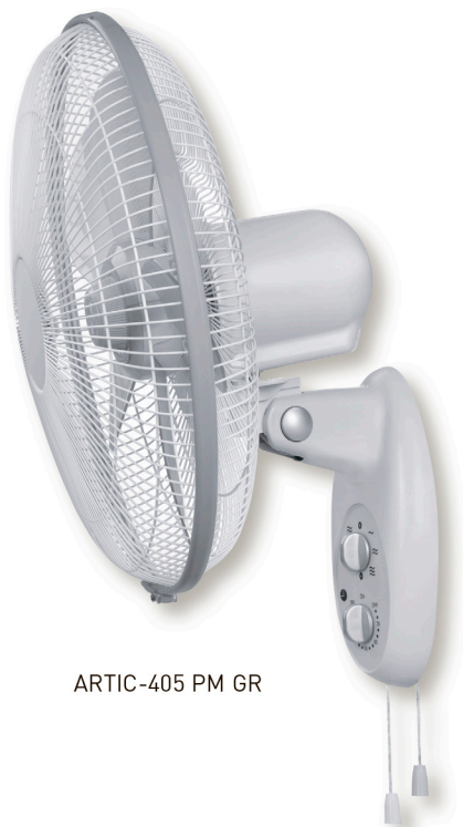
ARTIC-405 PM GR