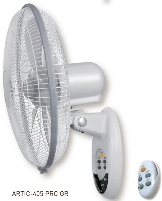
ARTIC-405 PRC GR

Настенные вентиляторы ARTIC PM/PRC GR обладают низким уровнем шума, имеют три скорости вращения и таймер.