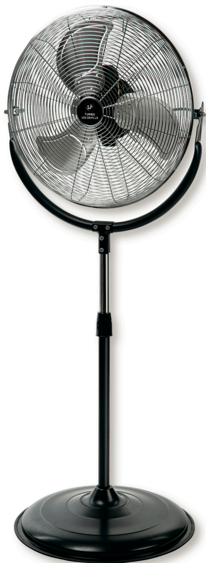
TURBO-455 CN PLUS