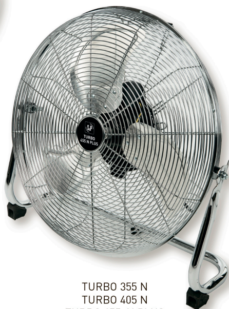
TURBO 355 N TURBO 405 N TURBO 455 N PLUS

Вентиляторы серии TURBO-N обладают высокой производительностью и предназначены для использования в общественных и промышленных помещениях. Доступны три модели для напольной установки с диаметром крыльчатки 360, 400 и 450 мм и одна модель на телескопической ножке с диаметром 450 мм. Вентиляторы комплектуются 3-х скоростными электродвигателями с защитой от перегрева и ручкой для переноски.